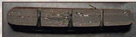
它牌煞車皮，使用後