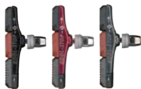
KS-TEC KS-TECR KS-TECS

Tectonic剎車片是一種鍛造合金支架，允許騎手自定煞車皮的準確位置。煞車皮設計成互鎖在一起，並側面固定到支架中。Pad-Lock™ 墊圈系統凸面樞軸調節納入到背板進行了改進；因此可實現所有間距要求所需的墊圈數量。Tectonic採用多摩擦化合物設置，但也可以配置單或雙材煞車皮。